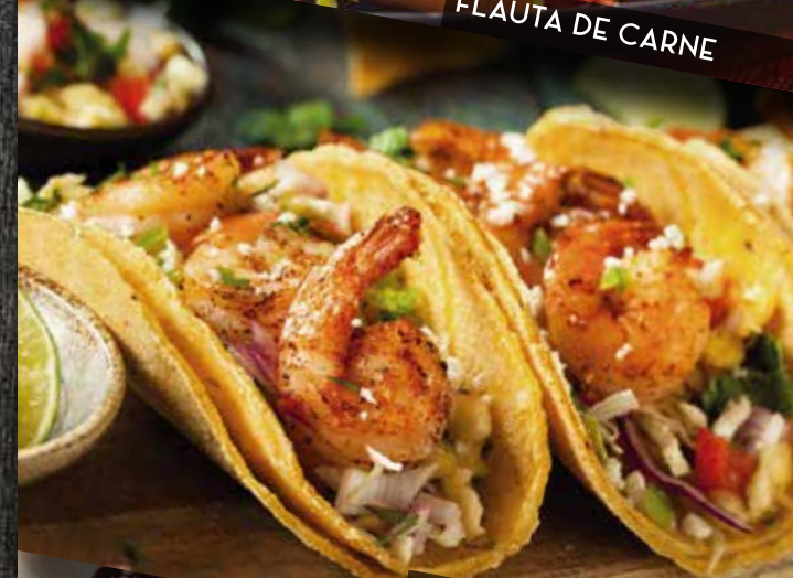
TACOS DE CAMARÓN