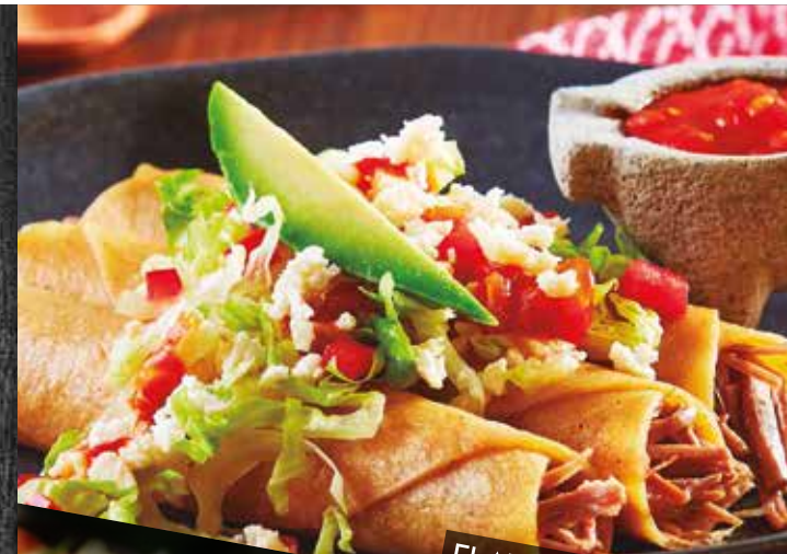
FLAUTA DE CARNE