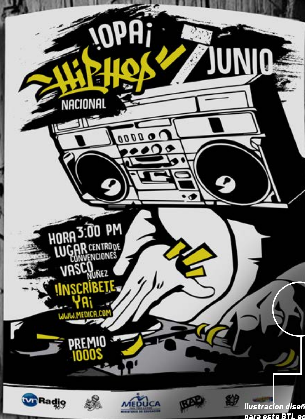
Ilustración diseñada exclusivamente para este BTL educativo