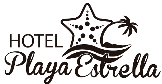
Blanco y Negro